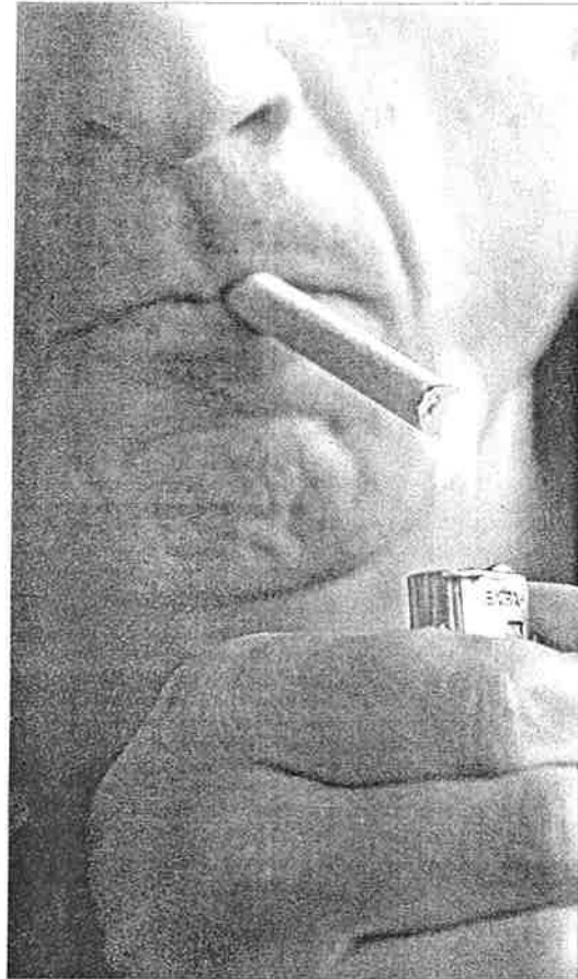
Un fumador encendiendo un cigarrillo.

El estudio de Picciotto y De Biasi ha comprobado por primera vez que el tabaco inhibe el apetito porque la nicotina activa una serie de neuronas que están directamente relacionadas con la sensación de saciedad. «El hipotálamo es un área del cerebro que integra las señales procedentes de nuestro intestino y se encarga de decir si necesitamos más alimentos